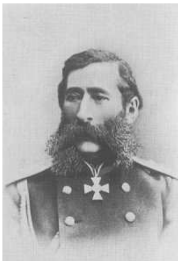
Михаил Тариэлович Лорис-Меликов

Царь и правительство оказались в «осадном положении». Рационально мыслящие люди при дворе понимали, что одним усилением репрессий дела не решить. Нужен был диалог власти и общества. В феврале 1880 г. на столичной политической сцене появился заслуженный генерал граф М.Т. Лорис-Меликов. Он получил от царя неограниченные полномочия для наведения порядка и возглавил Верховную Распорядительную Комиссию – чрезвычайный орган управления империей.