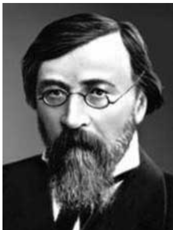
Николай Гаврилович Чернышевский

Радикальные демократы (Герцен, Чернышевский и др.) были сторонниками последовательного проведения принципа демократии (господства народа).