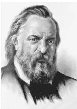
Александр Иванович Герцен

Народничество – идейно-политическое течение, представители которого считали, что будущее России – за крестьянским большинством народа, видели в крестьянской общине прямой путь к социализму.