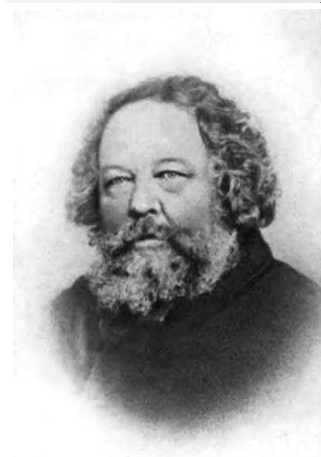
Михаил Александрович Бакунин

Представители народнического социализма (А.И. Герцен, Н.Г. Чернышевский) являлись по своим убеждениям радикальными демократами , выступавшими за наделение народа (абсолютное большинство которого составляло крестьянство) политическими и гражданскими правами, передачу народу всей полноты власти в государстве. В сущности, это были крестьянские революционные демократы.