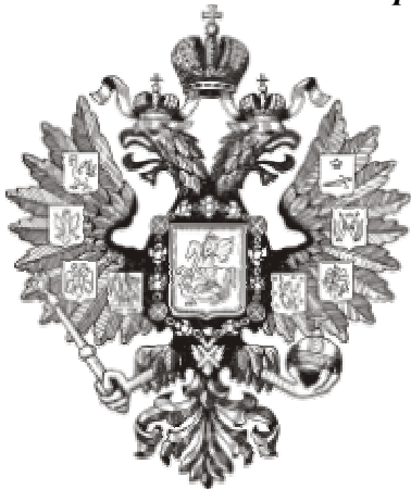
Герб Российской империи

За годы реформы Столыпина сельское хозяйство заметно продвинулось вперед: на \frac{1}{10} выросли посевные площади, на \frac{1}{3} – общая стоимость сельхозпродукции; рост урожайности хлебов составил 16-17 %.