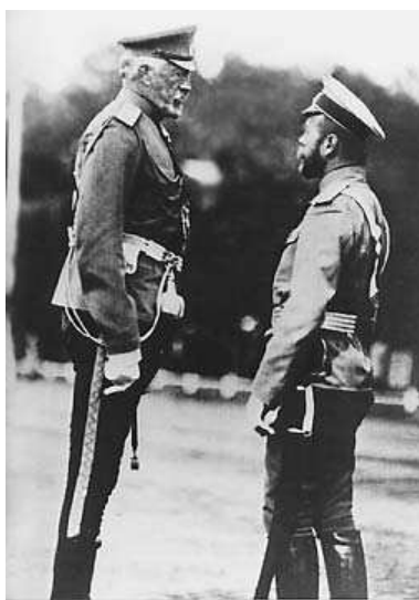
Два «Верховных»: вел. кн. Николай Николаевич и Николай II

В I Мировой войне Антанте противостоял Четверной союз: Германия, Австро-Венгрия, Турция, Болгария