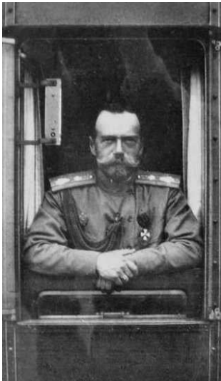
Николай II в императорском поезде

В годы войны Россия переживала глубокий финансовый и продовольственный кризис.