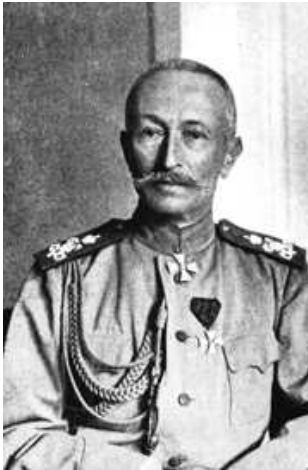
Алексей Алексеевич Брусилов

В августе 1915 г. Николай II сместил с поста Верховного Главнокомандующего великого князя Николая Николаевича, и сам занял его место, взяв на себя всю полноту ответственности за ход и исход военных действий российской армии.