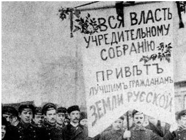
Петроград, 5 января 1918 г.

Но выборы в Учредительное собрание, прошедшие в ноябре 1917 г., уже при власти большевиков, не дали им большинства. Большевики получили в Учредительном собрании 24, 5% голосов, то есть не более ¼. Их союзники – левые эсеры – еще 5-6%. Сторонники либерального пути развития – кадеты и близкие к ним партии – получили не более 1/6 части голосов. Абсолютное большинство (51,7% голосов) завоевали правые эсеры во главе с Черновым.