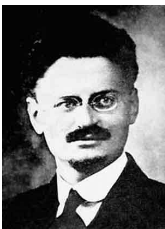
Лев Давидович Троцкий

Большевики подверглись преследованию: разгромлено было здание ЦК, редакции большевистских газет. Ленина решено было арестовать и судить как государственного изменника («германского агента») и организатора восстания с целью захвата власти.