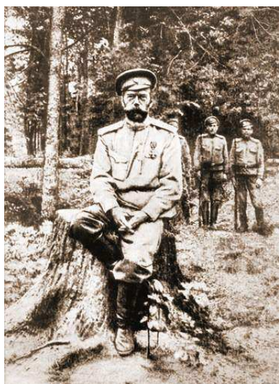
Николай II после отречения

Февральская революция 1917 г. выросла из экономического, социального и политического кризиса, переживаемого Россией во время войны: «верхи» не могли, а «низы» не хотели жить по-старому.