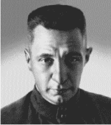
Александр Федорович Керенский

Во Временном правительстве, вышедшем из IV Государственной Думы, находились представители буржуазных партий, прежде всего, кадеты и октябристы (исключение составлял министр юстиции Керенский – социалист).