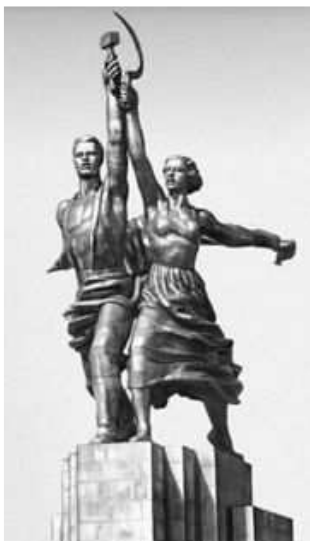
Вера Мухина. Рабочий и колхозница

В 1937 году в СССР широко отмечалось столетие со дня смерти А.С. Пушкина. Кто-то заметил: «Если бы Пушкин жил в XX веке, он бы все равно умер в 1937 году».