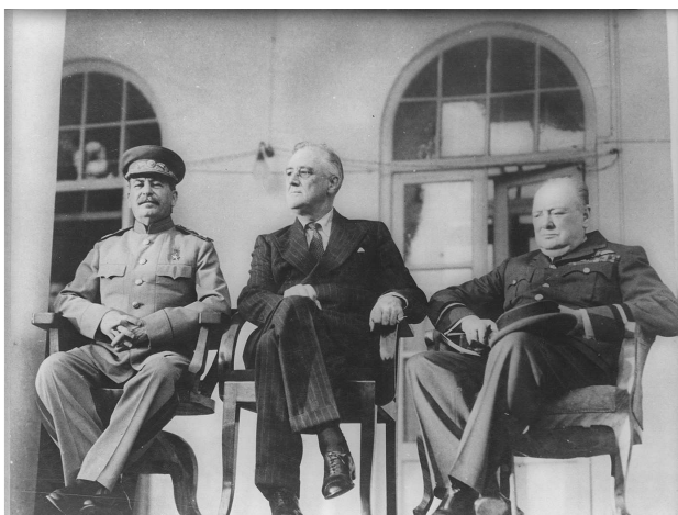
«Большая тройка»: Сталин, Рузвельт, Черчилль

Экономической основой коалиции стал ленд-лиз (льготная аренда стратегических материалов, продовольствия, техники, вооружений). Первые поставки по ленд-лизу были начаты уже в октябре 1941 г. и затем наращивались. Поставлялись артиллерийские орудия, танки, самолеты, автомобили (1/3 всего парка), алюминий, средства связи и т.д. Полученная от союзников техника составляла примерно 5 процентов от объема советского военного производства.