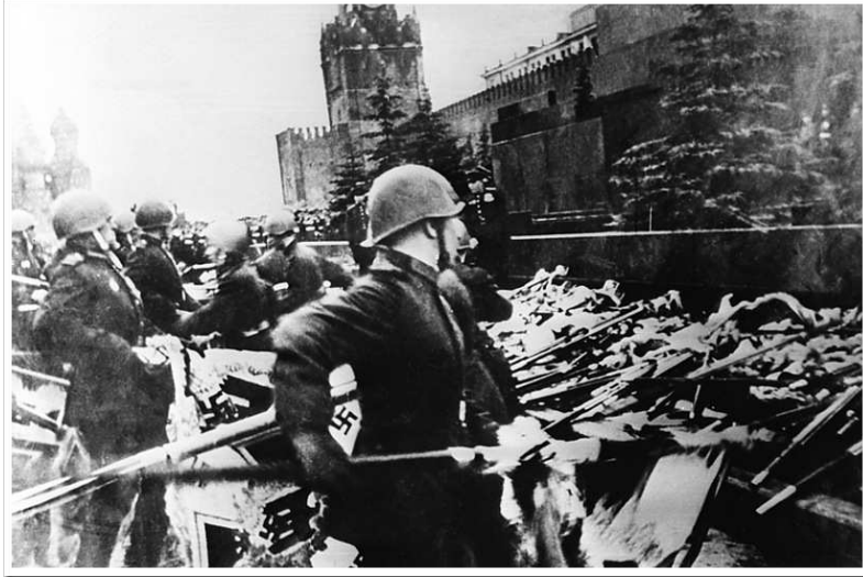
Парад Победы 24 июня 1945 г.

налаживании работы тыла важную роль сыграли заместители председателя СНК Н.А. Вознесенский, А.Н.Косыгин – организаторы советской военной экономики.