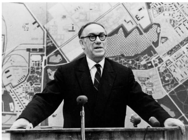
Михаил Алексеевич Лаврентьев

Вывод Спутника на околоземную орбиту демонстрировал технологическое лидерство СССР в космосе. Еще раньше, летом 1957 г. американцы наблюдали за испытанием советской межконтинентальной баллистической ракеты Р-7. Дальность ее полета составляла 8 тыс. км. Это означало потерю важного преимущества США в развернувшейся Холодной войне – стратегической неуязвимости.