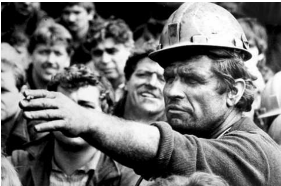
1989 год. Шахтеры

Летом 1989 г. по всей стране забастовали шахтеры: остановились шахты Кузбасса, Донбасса, Воркуты. Требования были просты: товары (особенно продовольственные) на полки, зарплаты на гора, сокращение управленческого аппарата, широкие права коллективам шахт. Эти забастовки всколыхнули всю страну.