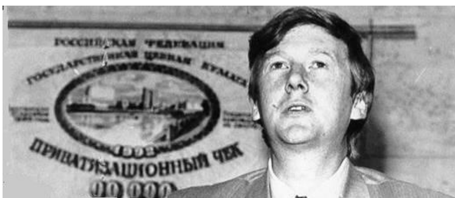
А. Чубайс и ваучер

Приватизация (от лат. privatus – частный) – процесс передачи государственной или муниципальной собственности в частные руки.