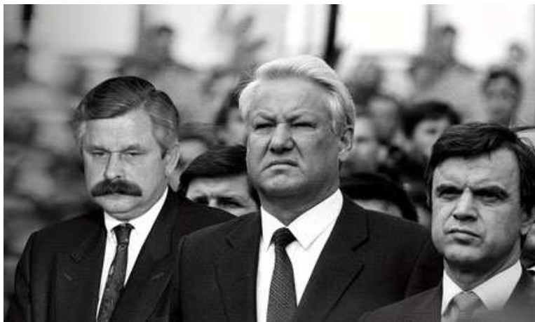
Руцкой, Ельцин, Хасбулатов

Уже в конце 1992 г. резко изменились представления народных депутатов РСФСР о курсе реформ. Четверть депутатов считала курс правительства в принципе неприемлемым, больше половины требовали серьезных корректировок, а поддерживали такие реформы немногим более 1/10.