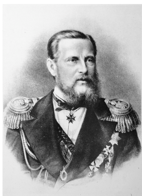
Император Александр II

В 1857 г. был учрежден Главный комитет по крестьянскому делу – его возглавил один из активных сторонников реформ брат царя великий князь Константин Николаевич. Затем возникли выборные (из дворян) губернские комитеты.