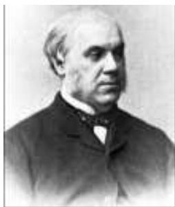
Николай Алексеевич Милутин – ведущий разработчик крестьянской реформы