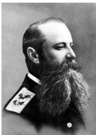
Степан Осипович Макаров – мореход, океанограф, кораблестроитель

Ход военных действий складывался неудачно для России. В марте-июле 1904 г. один за другим погибли двое командующих Тихоокеанским флотом – С.О. Макаров и В.К. Витгефт .