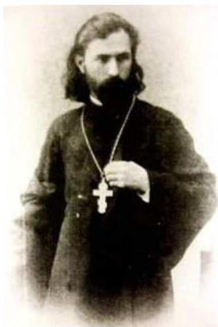
Георгий Аполлонович Гапон

На воскресный день 9 января 1905 г. было назначено мирное верноподданническое шествие рабочих к Зимнему Дворцу – резиденции царя.