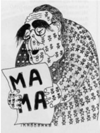
Брежнев.

Разительные несоответствия нарастали в социальной сфере. Если национальный доход страны увеличился за время Брежнева примерно втрое, то реальные доходы людей – лишь в два раза. Все больше давали о себе знать потребительские дефициты, особенно продовольственный дефицит. Увеличивались социальные привилегии. По-разному жили привилегированные общественные верхи и народ. Снижалась социальная динамика: с одной стороны, профессиональное семейное воспроизводство элит, с другой – воспроизводство рабочих, колхозников. Росло социальное неравенство.