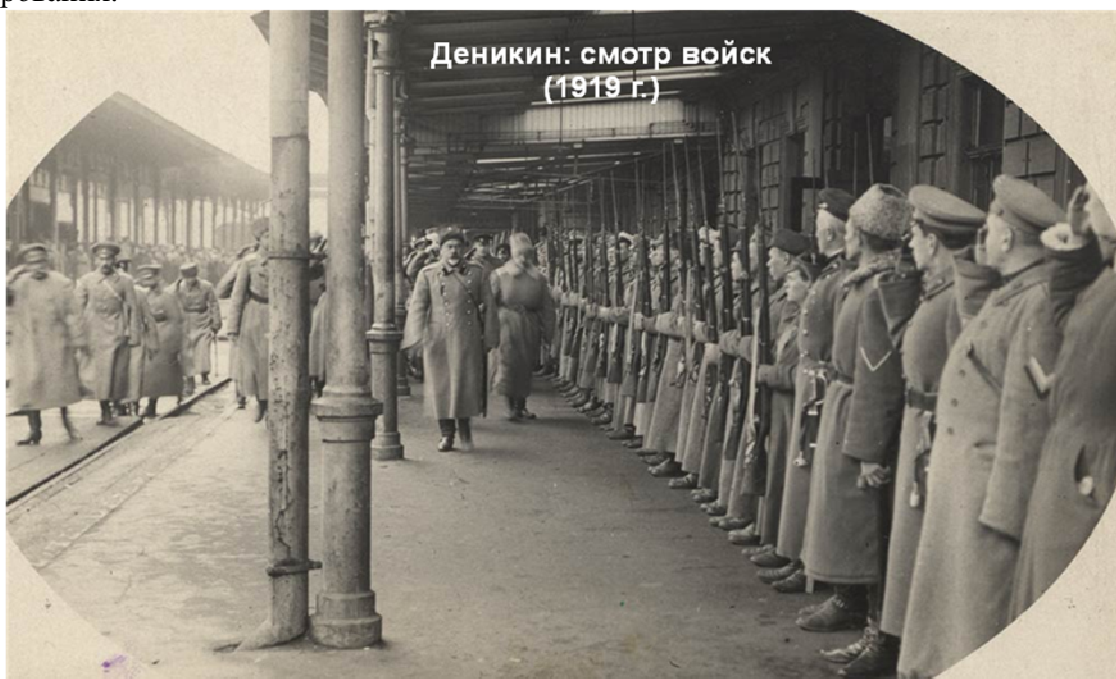
Деникин: смотр войск (1919 г.)

Общим местом в мемуарах белых генералов является сетование на малочисленность «белых» войск, которые слабо пополнялись, и многие соединения в течение всей Гражданской войны воевали одним и тем же, даже всё время убывающим, составом. Дело было, прежде всего, в недостатке продовольствия. Только там, где у белых имелось морское сообщение с иностранными покровителями (Вооруженные силы Юга России, например, имели доступ к черноморским портам), им удавалось сравнительно долго поддерживать воинские контингенты в сотни тысяч штыков и сабель. В остальных местах население соглашалось кормить лишь численно небольшие формирования.