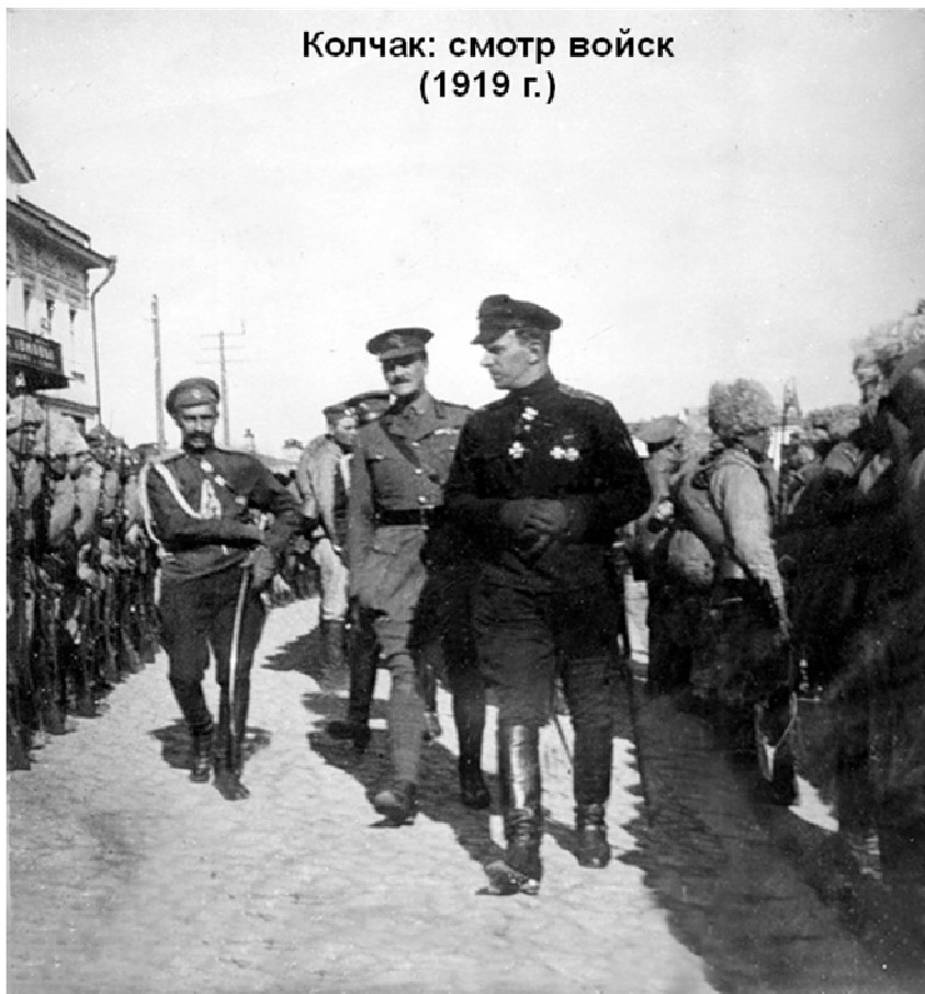
Колчак: смотр войск (1919 г.)

Общим местом в мемуарах белых генералов является сетование на малочисленность «белых» войск, которые слабо пополнялись, и многие соединения в течение всей Гражданской войны воевали одним и тем же, даже всё время убывающим, составом. Дело было, прежде всего, в недостатке продовольствия. Только там, где у белых имелось морское сообщение с иностранными покровителями (Вооруженные силы Юга России, например, имели доступ к черноморским портам), им удавалось сравнительно долго поддерживать воинские контингенты в сотни тысяч штыков и сабель. В остальных местах население соглашалось кормить лишь численно небольшие формирования.